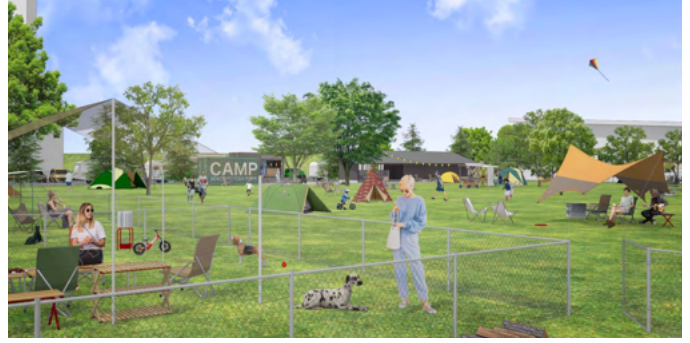
キャンプ場(イメージ) お子様や愛犬と自由な時間を楽しめる安心の区画サイト。