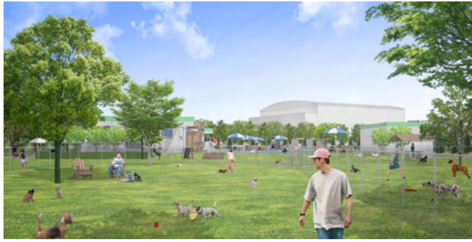
ドッグラン(イメージ) 2区画のドッグランエリアを設置。愛犬と一緒に楽しめる公園になります。