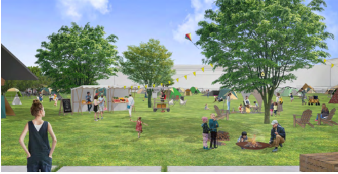
キャンプ場(イメージ) 自然体験を通じた様々なイベント・ワークショップを行います。