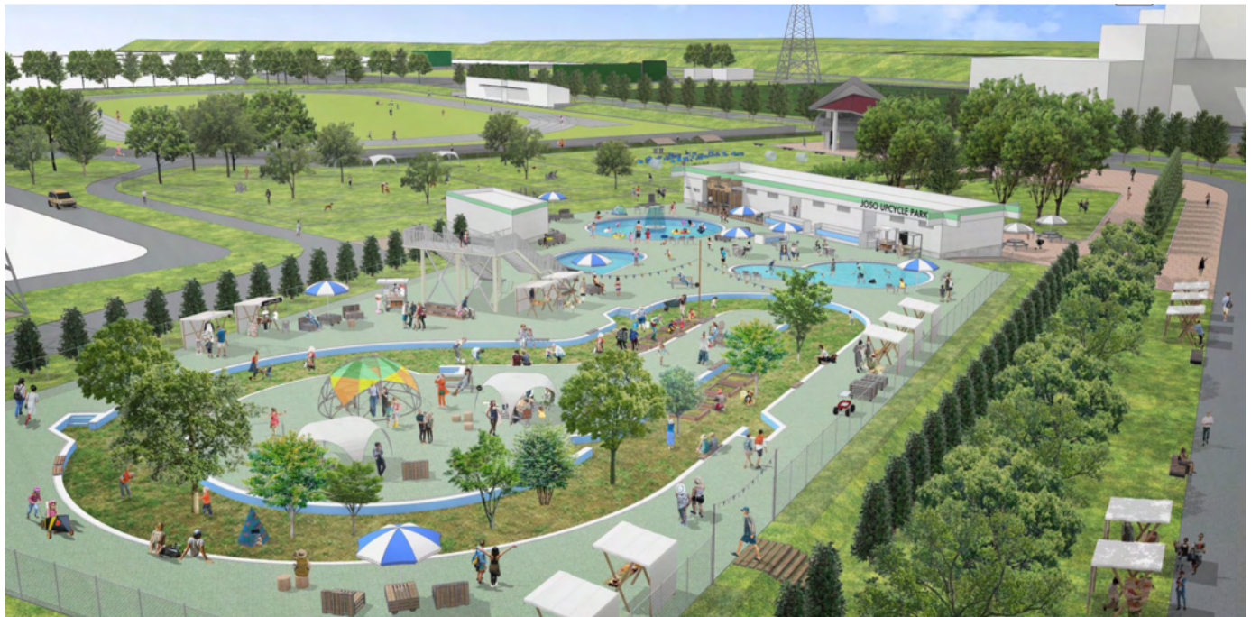
コミュニティガーデン、ドッグラン・ドッグプール(イメージ) 長年地域のみなさんに親しまれ、2021年閉鎖した流るるプールが新たな地域に開かれたコミュニティガーデンとして生まれ変わります。