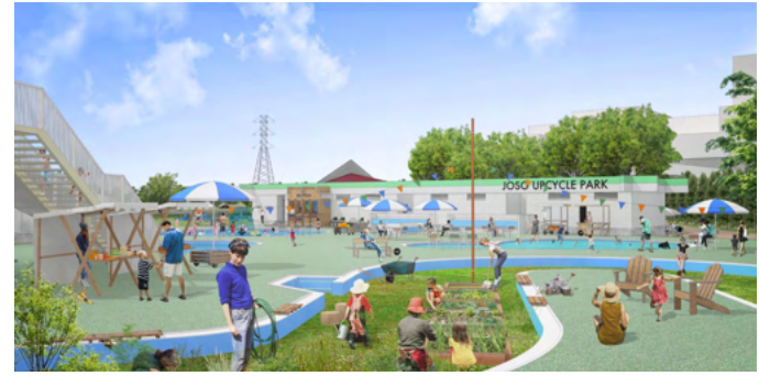
コミュニティガーデンからドッグプールをみる(イメージ) ドッグプールは大型犬用、小型犬用を用意します。